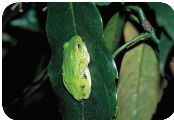
カエル シュレーゲルアオガエルは、里山の田んぼにしかいない さとやま た