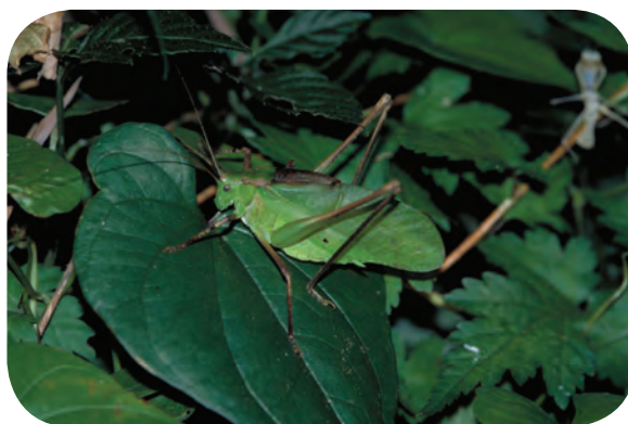
なむし 鳴く虫 市街地にはクツワムシはいなくなった しがいち