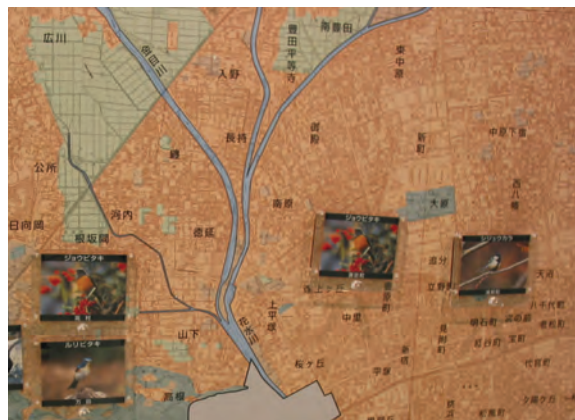
パズルをならべてみよう

かんきょう へんか 環境の変化のようすをつかむもう一つの て 手がかりとして、同じ平塚市内でもちがう おな ひらつか しな 地域のようすを比べてみるというやり方 ちいき くら があります。駅の近くは、ビルが建ち並び えき ちか た なら みどり 緑がほとんどありませんが、新幹線より西 しんかんせん にし の金目や吉沢、土屋などの地区には今でも かなめ きさわ つちや ちく いま 自然の豊かな環境が残されているからで しぜん ゆたかな かんきょうのこ す。博物館では、いろいろな生きものが市 はくぶつかん い し 内のどこにいるかを調べ、それをものさし ない にして環境の変化のようすをつかむ調査を長年続 かんきょう へんか ちようき なかねんつづ けてきました。パズルをしながら、地域による環境 ちいき かんきょう のちがいに注目してみましよう。 ちゆうもく