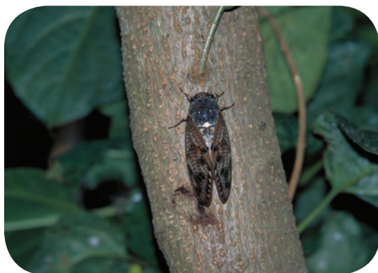
セミ しぜん 自然がなくなった地域ではアブラセミばかり ちいき