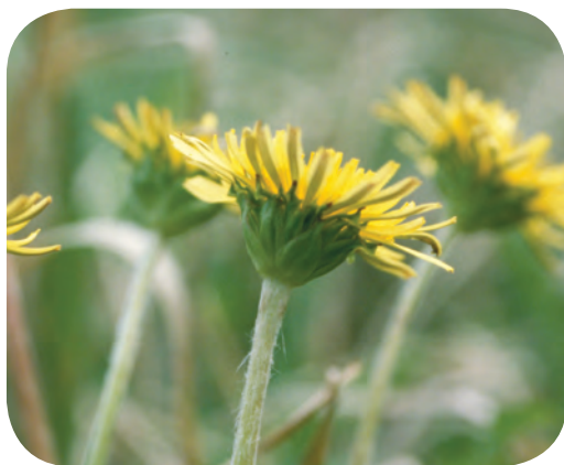
タンポポ しぜん 自然のゆたかな地域にはカントウタンポポがある ちいき