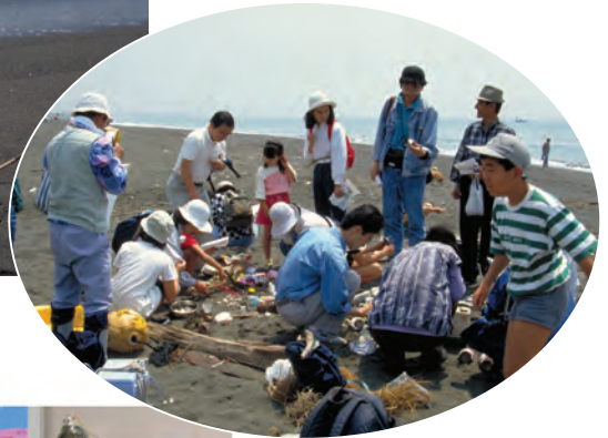
はくぶつかん しない にじがはまかいがん ひら 博物館が市内の虹ヶ浜海岸で開いている「漂着物を拾う会」→ まいつきたいにとようひ (毎月第二土曜日)