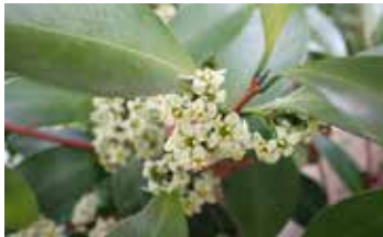
▲モクレイシ 2024年3月1日