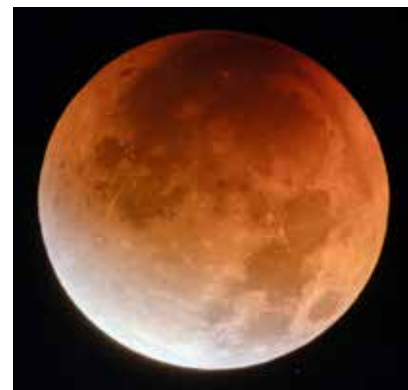
▲ 2025年9月8日に見られた皆既月食