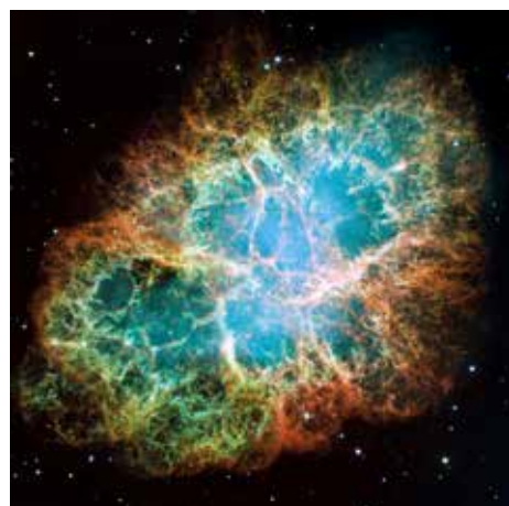
▲壮絶な星の死の痕跡「かに星雲」

「星空音楽館」はクラシック音楽を聴きながら、ゆったりと星空や映像をご覧ください。今回は主に“死”をテーマとした楽曲を聴きながら、星の生と死のドラマを追いかけてみます。