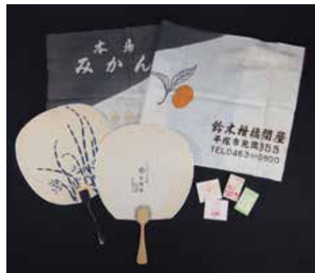
▲当館所蔵の市内のお店の手ぬぐい、うちわ、マッチ

本展示では、お店からもらえる手ぬぐい・うちわ・マッチなどはもちろん、当時のお店の分布図なども一緒に展示をします。