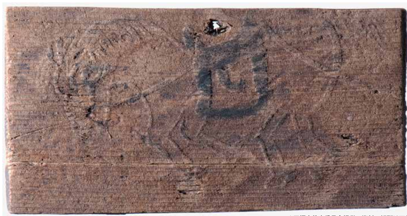
▲平塚市教育委員会提供 資料の解説は下部

謹んで新春のお慶びを申し上げます。また旧年のご恩顧にあたためて感謝申し上げます。