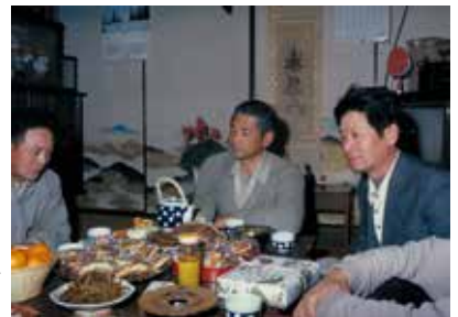
岡崎の庚申講の様子▶ (昭和50年4月6日撮影)