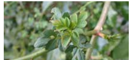
▲展開するノイバラの葉

事前申込制行事は右のQRコードから申込ができます。(博物館HPからも申込できます)