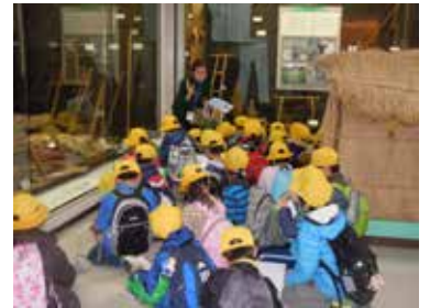
展示解説ボランティアの会