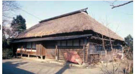
▲民家 昭和50年 平塚市徳延