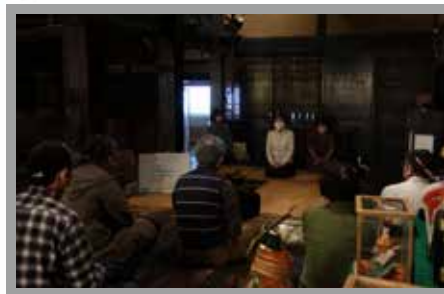
▲ろばたばなしの様子

事前申込制行事は右のQRコードから申込ができます。(博物館HPからも申込できます)