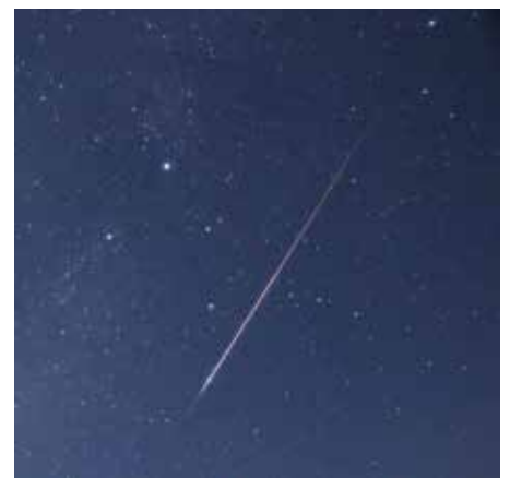
▲ペルセ群の流星