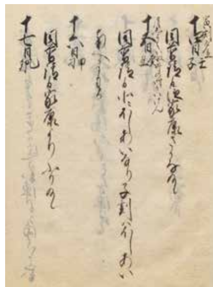
▲徳川家康の家臣・松平家忠の日記に残された月食と惑星食の同時食の記録 国立公文書館蔵