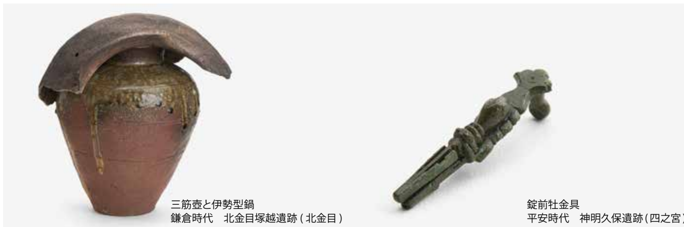
三筋壺と伊勢型鍋 鎌倉時代 北金目塚越遺跡（北金目）

令和4年（2022年）12月に平塚市指定重要文化財に新たに指定された三筋壺（1点）・伊勢型鍋（1点）、 錠前 さんきんこ 牡金具（1点）と、その他の市指定重要文化財の展示を行います。