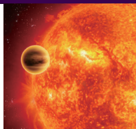
初めて発見された系外惑星の想像図

系外惑星の発見数などの現状や多様な系外惑星の姿を紹介するとともに、系外惑星の見つけ方や惑星の物理量の求め方などを解説します。