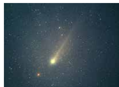
1986年5月に撮影された天変 (ハレー彗星)

日時：5月25日(土) 午後3時30分～午後4時30分 観覧料：200円(18歳未満65歳以上無料・65歳以上の方は年齢を確認できるものをご用意ください) ※観覧者全員が揃ってから観覧券をお求めのうえ、投影開始10分前までに3階にお越しください。