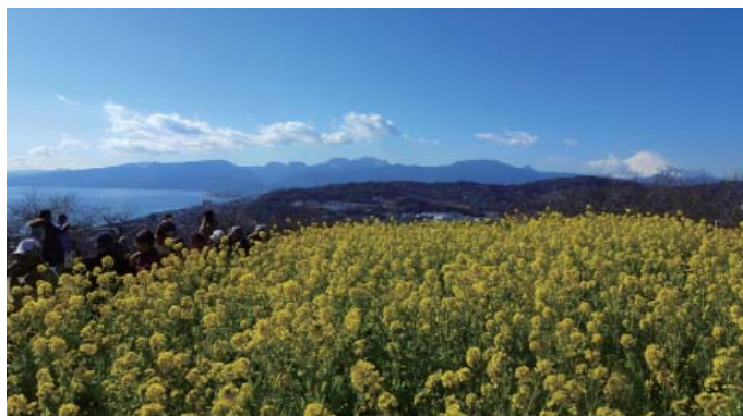
↑菜の花で有名な吾妻山山頂からみた相模湾と箱根。吾妻山はなぜこんなに高いのでしょうか？そして箱根との関係は？