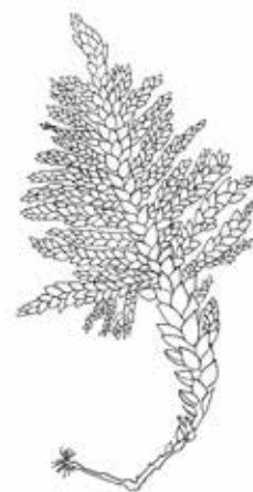
オオトラノオゴケ（画/佐藤恭子）

なんとなく、いろんな種類がありそうだ、ゼニゴケは見た目がちょっと…など、コケに対するイメージは人によって異なるでしょう。とても身近な生き物なのに、コケのことはあまり知られていません。この展示では、コケというのはどんな生き物なのかを紹介します。平塚のコケは、湘南コケの会が12年に渡って調査を行ってきました。この展示は湘南コケの会のみなさんと一緒に作成し、調査で得られたものが随所にちりばめられています。最近その美しさが話題になることの多いコケですが、この機会に鑑賞から一歩踏み込んだコケの世界をご覧ください。