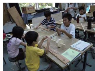
縄文人になろう (火起こし道具作り)

内容：火起こしや弓矢の体験を通して縄文人の技に迫ります。 日時：8月20日(土) 午前10時～午後4時 場所：野外・科学教室 定員：20名 対象：小学4年生～中学3年生 申込：往復はがきに住所、氏名、電話番号を記入し、8月10日(水)までに申し込む。