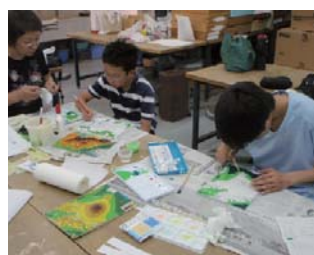
地形模型を作ろう

内容：厚紙を切り抜いて積み重ね、地模型を作ります。 日時：8月16日(火)・8月19日(金)の午前9時～午後4時 場所：科学教室 参加費：1800円 定員：20人 対象：小学4年生以上で2日間参加できる方 申込：往復はがきに住所、氏名、電話番号を記入し、8月7日(日)までに申し込む。