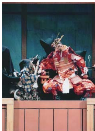
前取座 絵本大功記