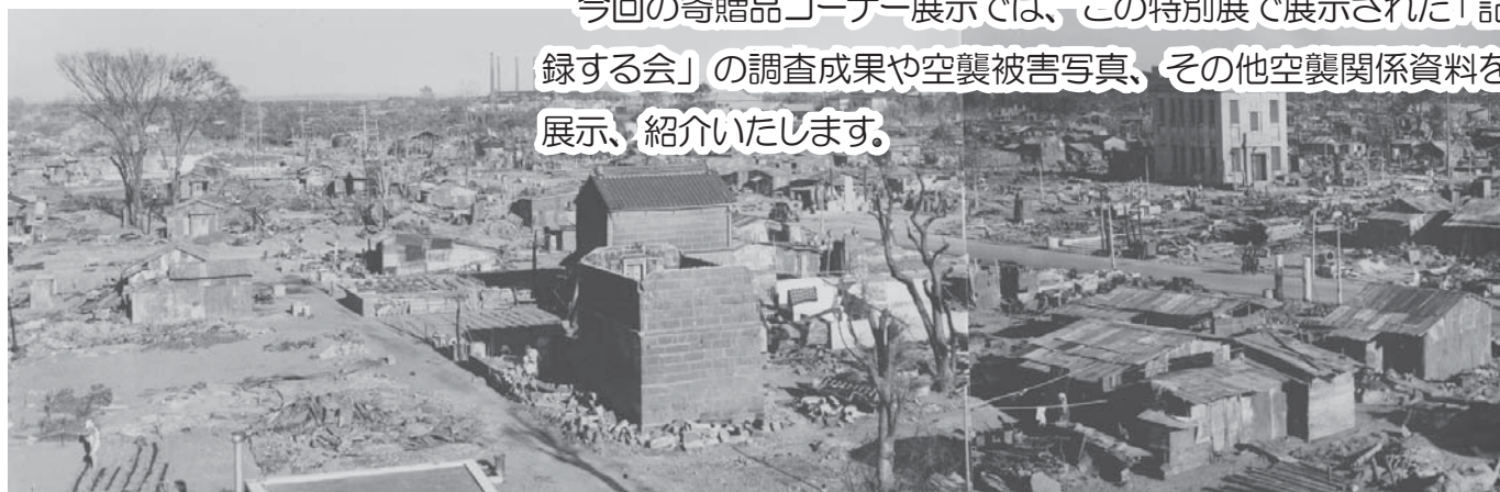
空襲被災後の平塚市街

今回の寄贈品コーナー展示では、この特別展で展示された「記録する会」の調査成果や空襲被害写真、その他空襲関係資料を展示、紹介いたします。