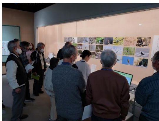
学芸員による展示解説の様子