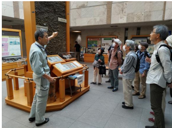
温泉地学研究所にて