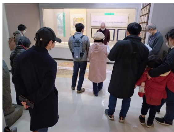
歴史；弥次さん喜多さん平塚ぶらり旅