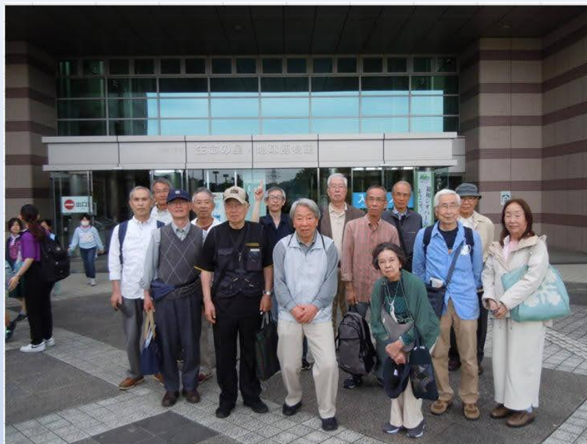
生命の星・地球博物館前で