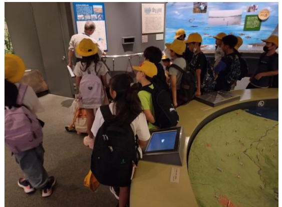
小学校の展示解説の様子