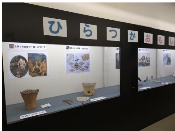
展示解説ボランティアの展示

令和7年2月7日（金）～27日（木）の期間中、「ひらつかおもしろ話、いい話」のタイトルで、6分野から選んだテーマで実演を行いました。