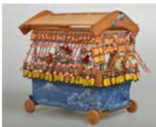
日枝神社例大祭の山車