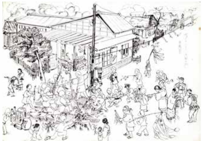
セートバレー（道祖神祭）