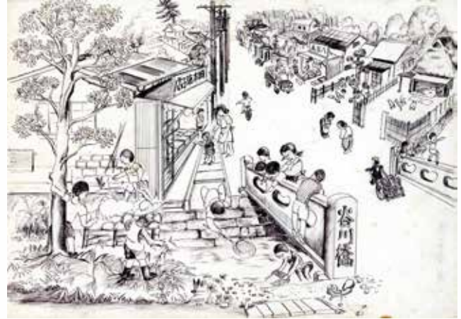
谷川にも魚がいた