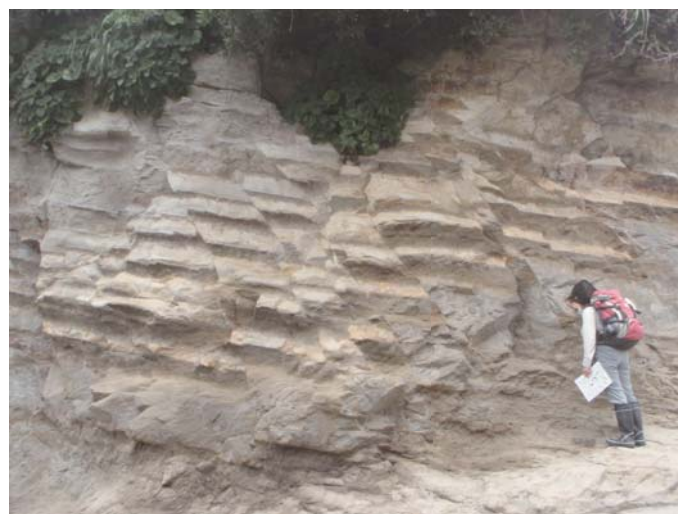
▲東西性で南傾斜の逆断層が平行して数多く認められます。白い地層（軽石層）が何度も断層で繰り返し、南側の地層が北側へ乗り上げています、これは本州弧に付加したことを示しています。

ここでは、相模川流域・酒匂川流域、湘南地域など、当館が日頃活動の場としている地域の、地質景観が素晴らしい場所、30箇所を紹介します。ふだん、何気なく見ている景観も、火山地形や溶岩、段丘地形と隆起、付加体を示す地層、深海の堆積を示す地層、海底火山活動の証拠、平野の形成など、様々な過去の大地の形成や変動の過程を物語っています。そうした大地の成り立ちを示す証拠である岩石標本も展示します。多数の方のご来館をお待ちしています。