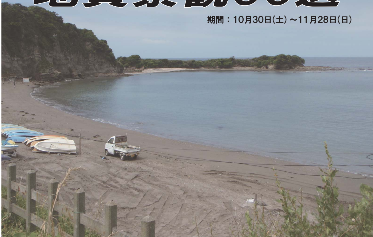
▲深海に堆積した地層が本州に付加したことを物語る長者ヶ崎

ここでは、相模川流域・酒匂川流域、湘南地域など、当館が日頃活動の場としている地域の、地質景観が素晴らしい場所、30箇所を紹介します。ふだん、何気なく見ている景観も、火山地形や溶岩、段丘地形と隆起、付加体を示す地層、深海の堆積を示す地層、海底火山活動の証拠、平野の形成など、様々な過去の大地の形成や変動の過程を物語っています。そうした大地の成り立ちを示す証拠である岩石標本も展示します。多数の方のご来館をお待ちしています。