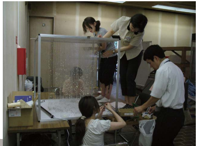
模型製作現場の苦闘 （ひとつひとつの銀河を手作業で配置しました）

また、SDSS観測で使われたアルミの穿孔板（実物）も展示しました。広視野の2.5m望遠鏡に取り付けられ、目標天体の位置に合わせてあけられた穴から、光ファイバーケーブルを用いスペクトルの観測装置に光を送り込むためのものです。こうして一度になんと600以上の銀河を観測できる仕組みになっていました。