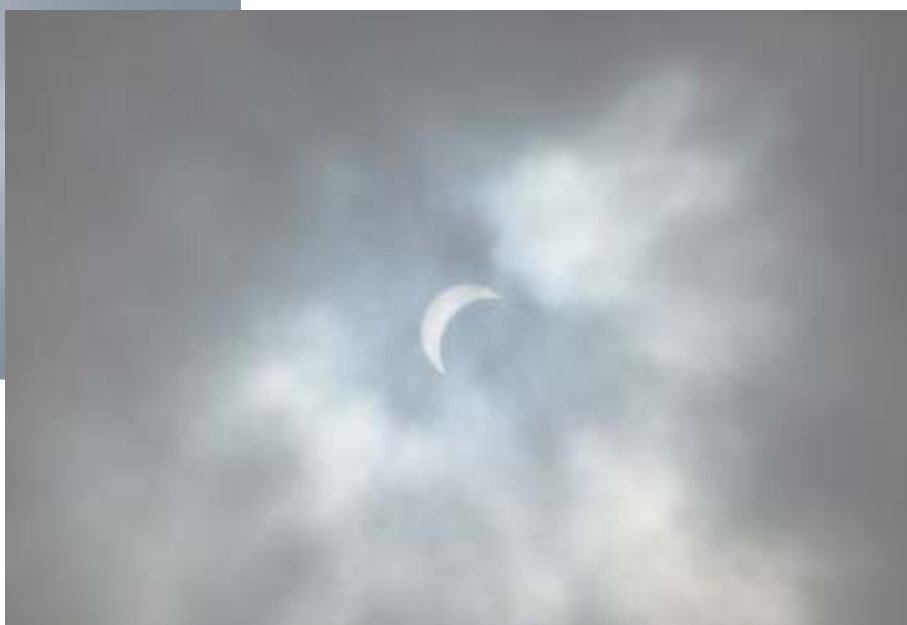
11時18分(天体観察会 水永氏撮影)