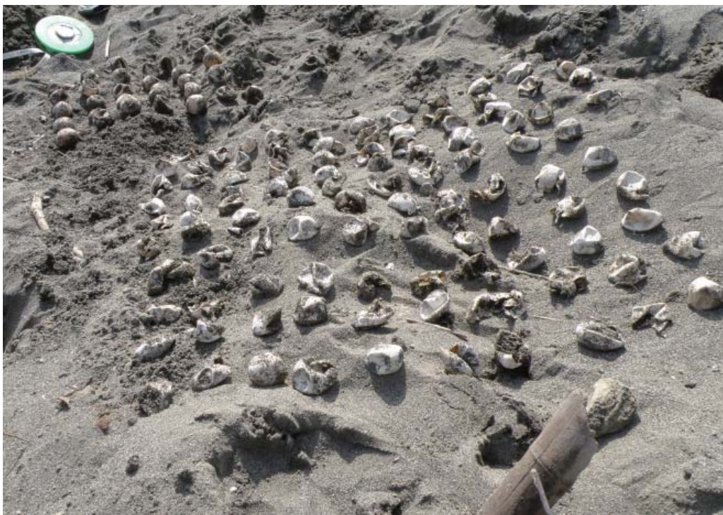
孵化したウミガメの卵の殻

2008年8月中旬、平塚海岸から約100匹のアカウミガメの子どもたちが、海に向かって出発しました。上の写真は、その子ガメたちの残した卵の殻です。