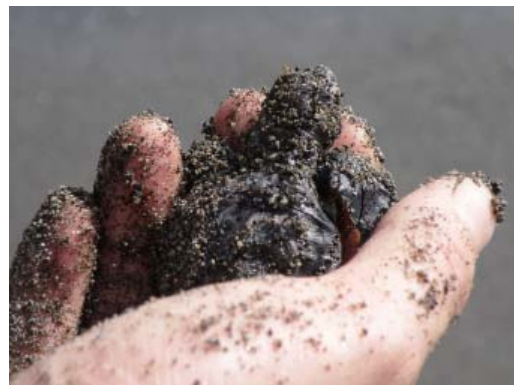
巣の中に残っていた子ガメ

平塚海岸でのアカウミガメの産卵が確認されたのは、1996年以来12年ぶりです。今年（2008年）は全国的にアカウミガメの産卵が多く報告されました。神奈川県内でも他に、藤沢や小田原の海岸で産卵が行われました。平塚海岸に産卵された卵の殻と未ふ化の卵、それからふ化したものの砂からはい出せず、死んでしまった個体（1個体）は平塚市博物館で資料として保管しています。今回の展示ではそれらの資料を紹介します。