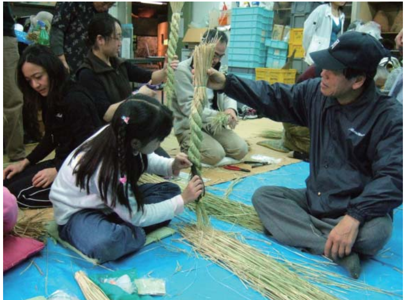
—昨年のお飾りを作ろうの様子

しめ飾りは、注連縄に装飾を施したものであり、基本は縄です。初めての方は、講師とスタッフが縄のない方から手取り足取り指導しますので、大丈夫です。手作りのお飾りで新年を迎えてみませんか。