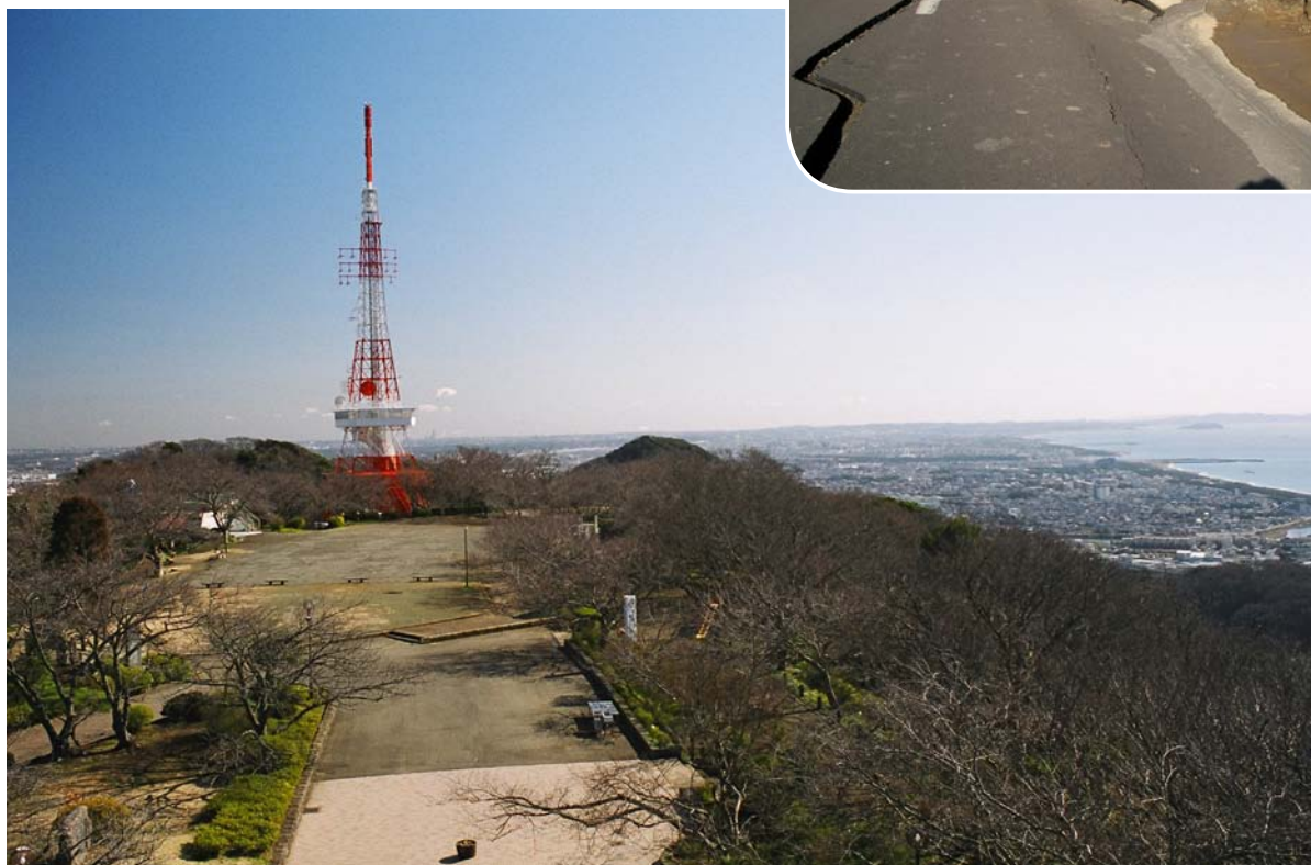
上 液状化で浮き上がったマンホール (新潟県中越地震) 左 かつての礫が地震で隆起した湘南平