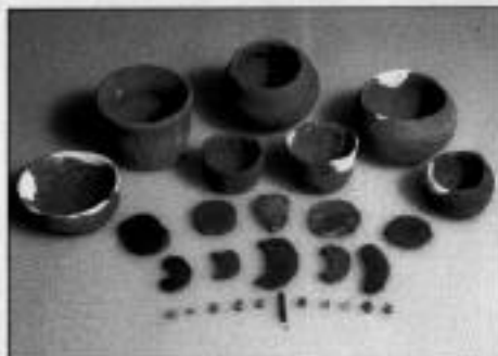
まつりに使われた道具。小型の土器や、鏡・勾玉を石で表現しています。古代人の祈り・願いと。現代社会に通じるか。

*本屋さんには置いてありません。購入ご希望の方は博物館受付でお求め下さい(郵送可。送料別)。850円。『市史』は4000円。