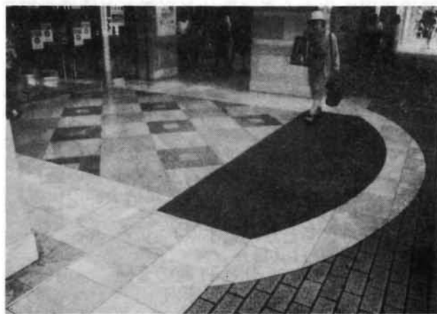
▲ラスカ入口の床にはイタリア産の様々な色合いの大理石が使われている