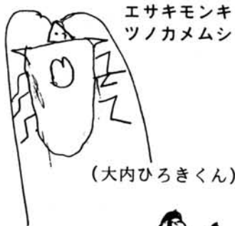
エサキモンキ ツノカメムシ