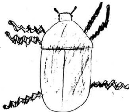
カブトムシ (磯部さきさん)