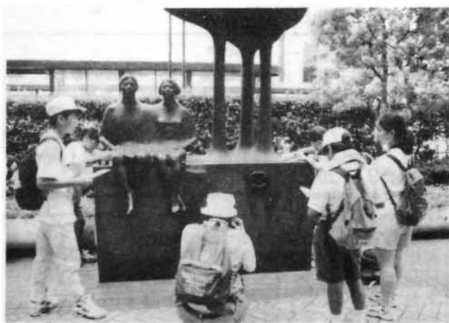
▲ラスカ前の「星たちの明日像」の台座はアメリカ産閃長岩

駅周辺には研磨された外国石材がたくさん使われており、目を楽しませてくれます。梅屋などには珊瑚などの化石が入った石灰岩も使われており、化石探しをしてもおもしろいでしょう。（森記）