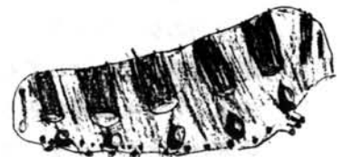
キアゲハの幼虫 (金松麗さん)