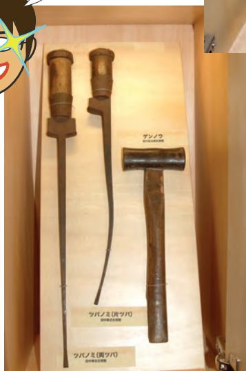
むかしの道具(なにに使ったのかな?)