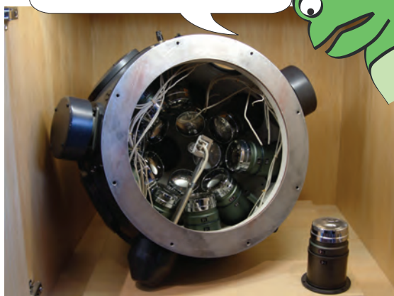
プラネタリウム投影機の一部