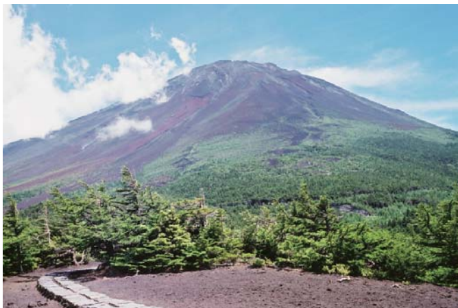
黒い砂は富士の火山灰だった

昨年12月16日、湘南地域を中心として神奈川県南部の9市9町で黒い砂が積もっているのが話題になり、有害物質ではという疑念もあり、新聞・テレビなど各種メディアで取り上げられました。平塚でも車のフロントガラスを見ると確かに真っ黒く細かな砂が積もっていました。県などの分析の通り、収集して顕微鏡で見ると、トゲトゲした粒子で結晶も含まれており、火山灰ということがわかりました。黒い砂の分布と、上空に吹く風が西風であることを考えると富士山方面から飛来したことになりますが、富士山が噴火したという形跡はなく、何故、飛んできたのかが謎となりました。結局、富士の火山斜面の裸地の火山灰が強風で巻き上げられたものらしいという結論となりました。考えて