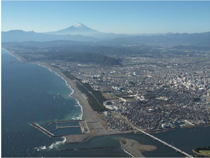
相模川河口から西湘を望む

今回の特別展では、湘南地域（大磯～平塚～姥島～江の島～三浦）と相模湾を中心として、湘南地域がかつて相模湾の深海からどのように生まれ、現在に至っているのかという湘南の誕生物語を、陸域と海域の資料から時代を追って紹介します。近年、相模湾に潜航して得られた深海相模湾に関する映像や実物試料を海洋研究開発機構（JAMSTEC）の全面的なご協力のもとに公開し、相模湾が地質的にも生物的にも多様性に富む湾であること、相模湾と湘南地域が地球科学的に密接な深い関係がある