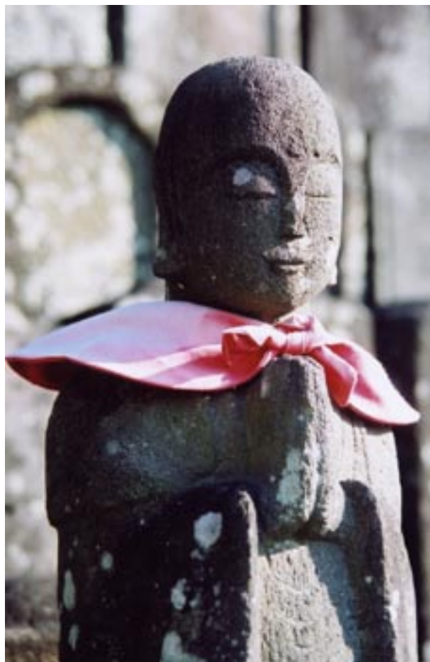
大念寺六地藏の一体。合掌像。