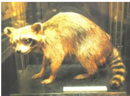
展示中のアライグマの剥製

● コハクオナジマイマイ ／西日本原産のカタツムリで、殻の中央に黄色い内蔵が透けてみえるのが特徴です。植木か何かについて持ち込まれたらしく、1998年に平塚の土屋で見つかったのが関東地方では2ヶ所目の発見でした。その後グングンと増え、今では土屋や吉沢ではもっとも数の多いカタツムリになっています。農作物に被害を出している場所もあり、今後の動向が気になる種類です。